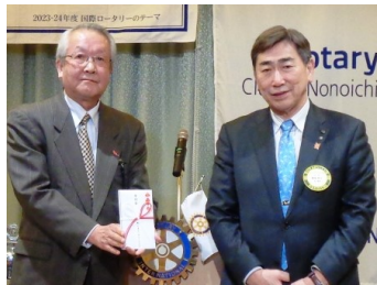
歳末助け合い寄付金贈呈