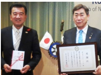
絵本寄贈の目録贈呈 および感謝状贈呈